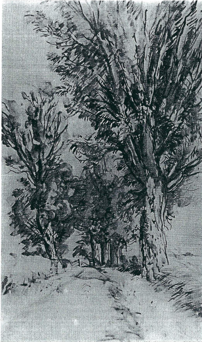
Johan Dijkstra – Landschap bij Oostum (aquarel).

Inderdaad „De Eendragt” met een g in plaats van ch, maar dat was dan ook de schrijfwijze 150 jaren geleden.