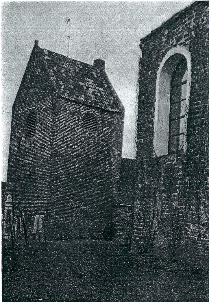
Kerk te Ezinge